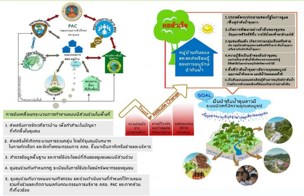
รูปแบบ (Model) การส่งเสริมและพัฒนาการมีส่วนร่วมของชุมชนในพื้นที่ป่าอนุรักษ์ (สสอ.) : พื้นที่ป่าต้นน้ำขุนลาว (ในเขตอุทยานแห่งชาติขุนแจ จังหวัดเชียงราย)